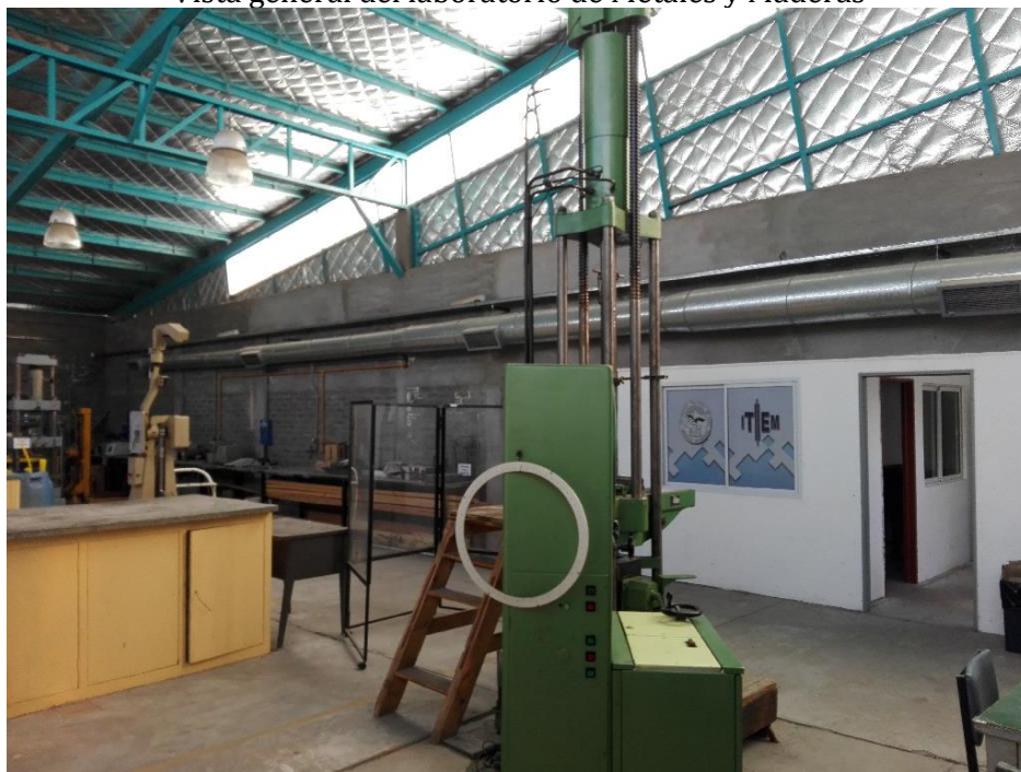
Otra vista del laboratorio de Metales y Maderas