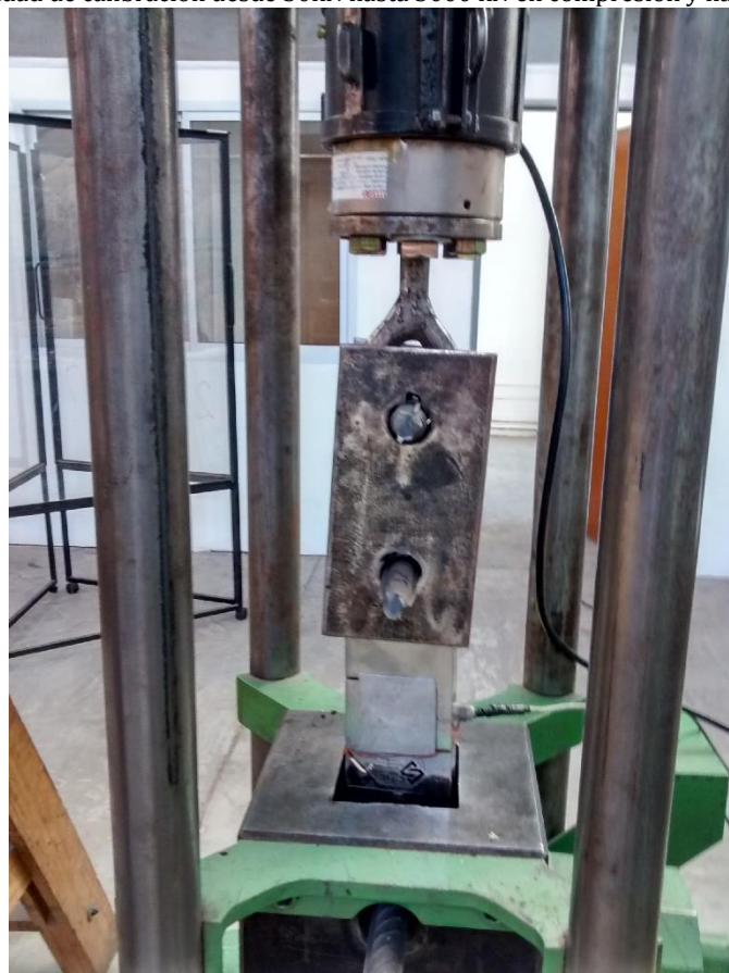
Detalle del proceso de calibración de una celda a tracción