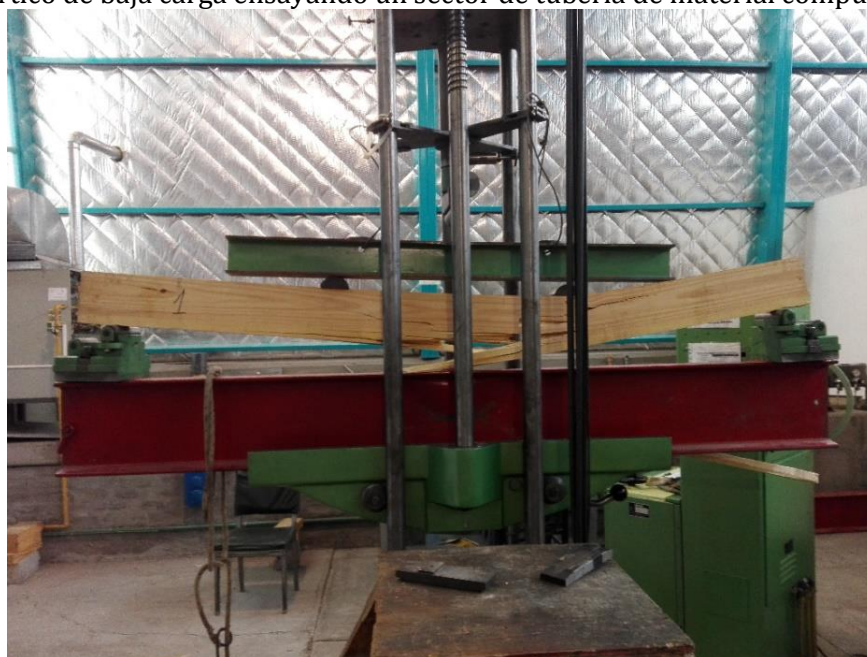
Ensayo de flexión de viga de madera laminada