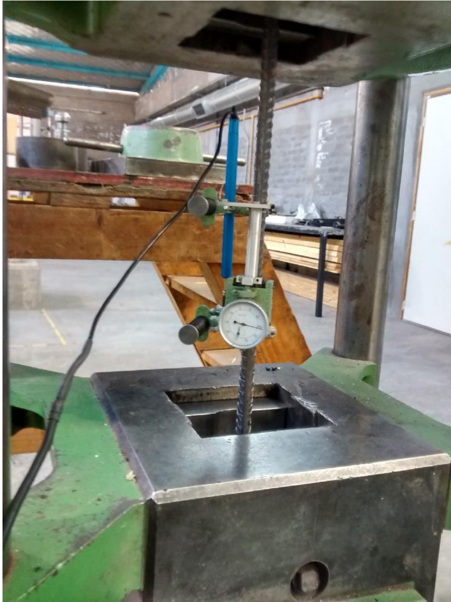
Detalle de un ensayo a tracción de una barra de construcción con determinación de la deformación, tanto analógica como digitalmente.