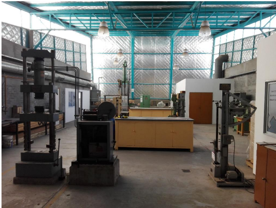
Vista general del laboratorio de Metales y Maderas