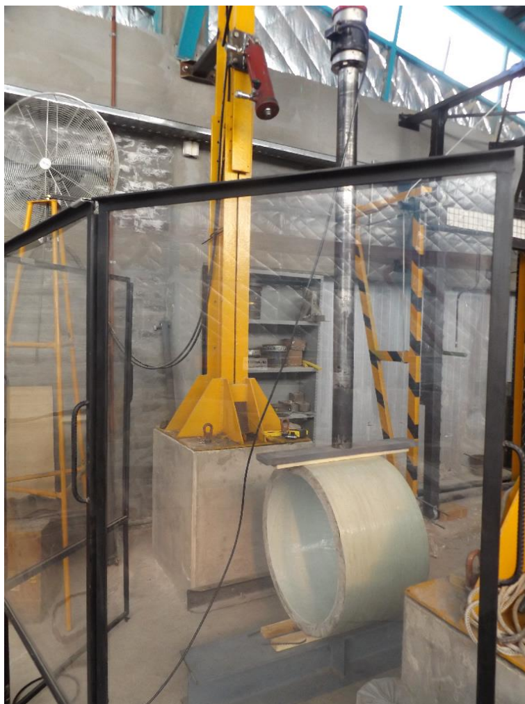
Pórtico de baja carga ensayando un sector de tubería de material compuesto