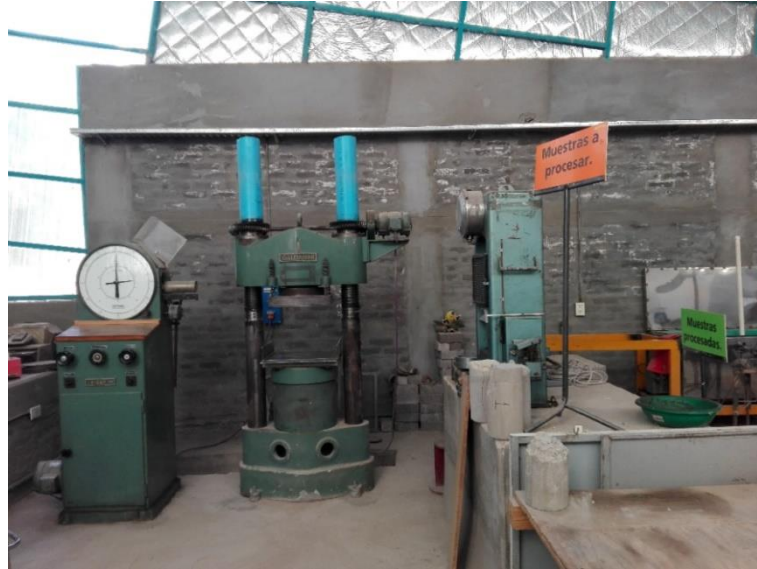
Sector de ensayo de probetas de hormigón