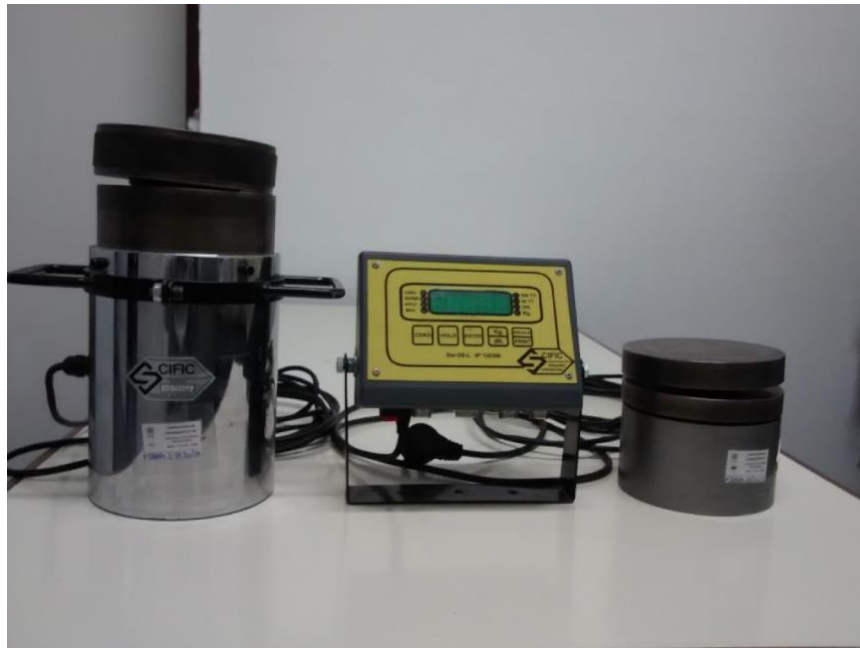
Dos de las celdas para calibración de equipos de fuerza propias del Laboratorio de Metrología. El ITIEM tiene capacidad de calibración desde 30kN hasta 3000 kN en compresión y hasta 200 kN en tracción